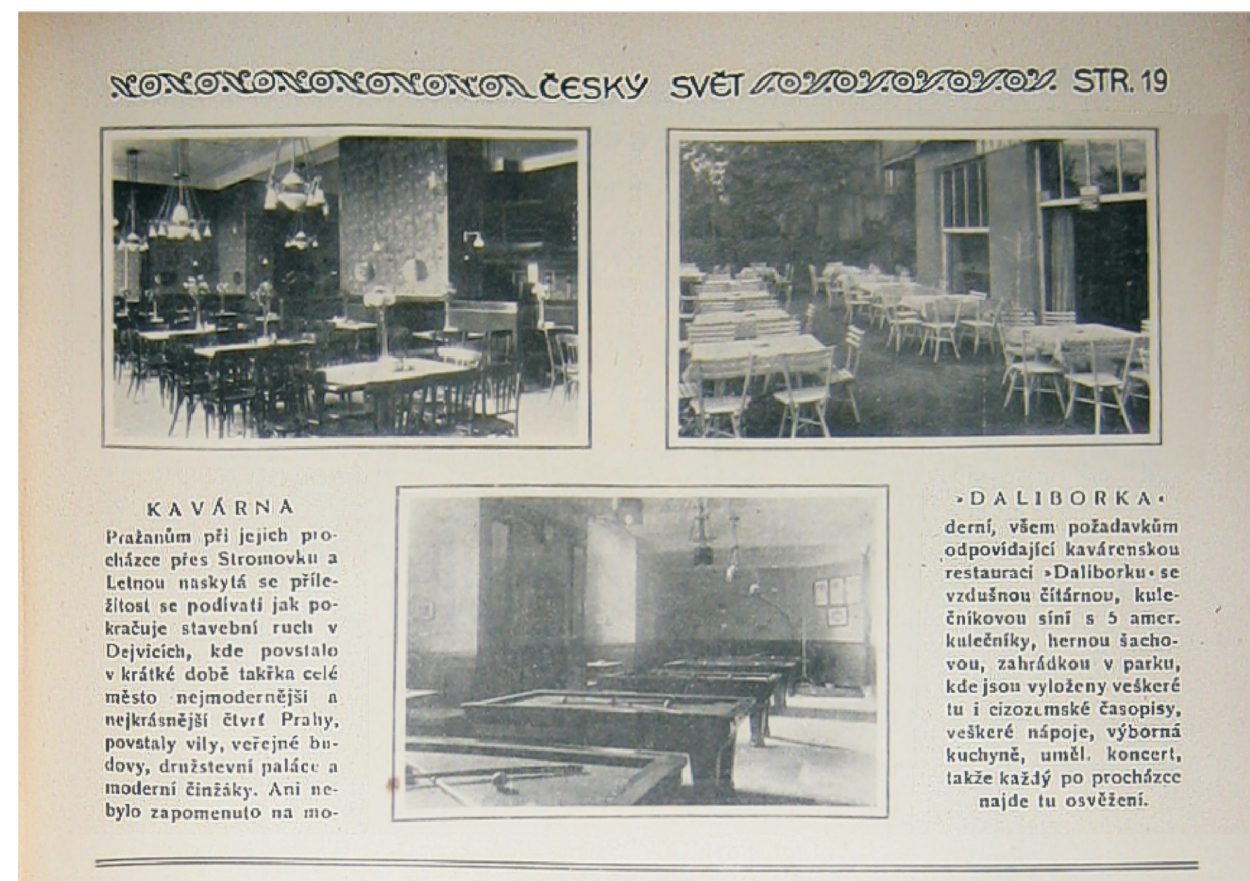
časopis český svět 1924